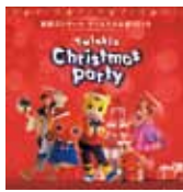
しまじろう